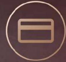
Tarjeta Tradicionales (Banda magnética)

Todos los métodos de pago están bajo un solo equipo, procesa tarjeta IC: cumple con las normas PBOC3.0 y EMV / NFC: PBOC3.0, ISO/ICE 14443, tipo A y B, tarjeta MIFARE, QPBOC, tarjetas de banda magnética 1/2/3, deslizamiento bidireccional y cumple con las normas ISO7810/7811.