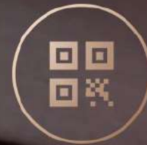
Código QR (Pago móvil Apps Wallets)